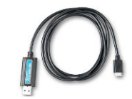
VE.Direct naar USB interface