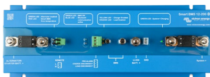
Smart BMS 12/200