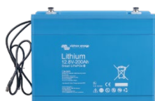
Lithium Battery Smart 12,8 V & 25,6 V